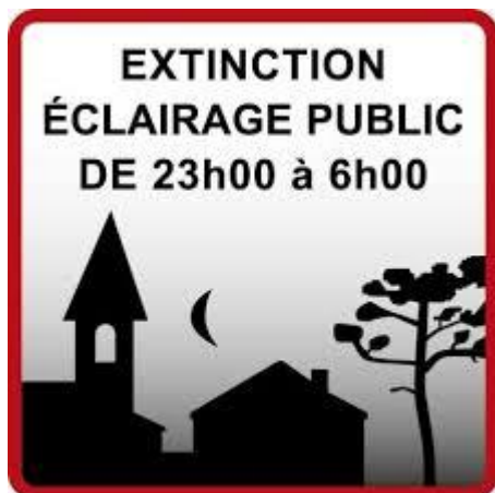
Exemple non contractuel de panneaux

La commune va appliquer cette décision qui nécessite des modifications techniques délicates. Cela devrait être effectif dans les prochains jours.