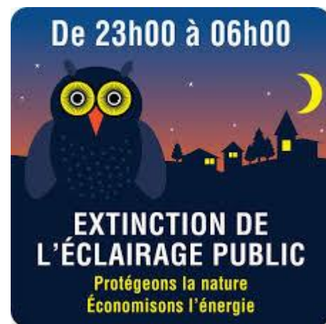
Exemple non contractuel de panneaux

Nous attendons la fourniture de panneaux pédagogiques fournis par la communauté de communes pour informer les citoyens.